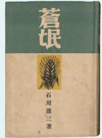
石川達三『蒼氓』 1935(昭和10)年10月 改造社 表題作「蒼氓」のほか「石女」「毒草苑」「霧海」を収録。「蒼氓」は、同年創設された第1回芥川龍之介賞の受賞作。