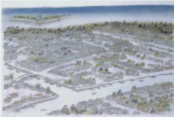
風間完画 山本周五郎「縦ノ木は残った」イメージ画

前年に谷崎は千代夫人と離婚、千代は佐藤と再婚し、谷崎はこの年4月、古川十未子と再婚した。書簡は結婚直前の谷崎を訪問した佐藤夫妻が東京に戻って間もない時のもの。千代の妹せい(女優の葉山三千子)の身の振り方についての相談や谷崎原作の舞台への誘いなどが記される。